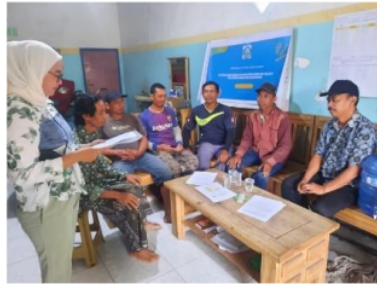
Gambar 1. Penyampaian Materi dan Tanya Jawab

Setelah tahapan persiapan seluruhnya telah dilakukan, selanjutnya dilakukan tahap pelatihan terkait permasalahan yang dihadapi oleh petani.