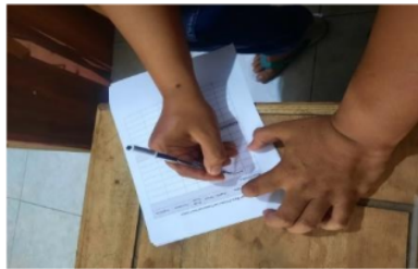
Gambar 3. Praktik pencatatan akuntansi sederhana

Selanjutnya pada akhir kegiatan pelatihan, peserta diberikan form untuk melakukan praktik pencatatan akuntansi. Praktik ini bertujuan untuk melatih peserta pelatihan dalam mencapai tujuan dari materi yang telah diberikan sebelumnya. Form yang telah diberikan dikerjakan bersama-sama dengan narasumber agar peserta pelatihan lebih paham akan praktik dari materi yang telah diberikan. Setelah selesai dikerjakan, kemudian dilakukan evaluasi ditempat agar peserta dapat mencatat hal-hal yang benar dan sesuai.