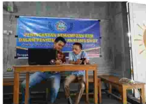
Gambar 3. Pembahasan Faktor-faktor Analisis SWOT

Kemudian kegiatan dilanjutkan dengan pembahasan terkait faktor-faktor yang menjadi kekuatan dan kelemahan Kedai kopi Rakyat Bondowoso, serta faktor-faktor apa saja yang dapat menjadi peluang serta ancaman bagi Kedai Kopi Rakyat bondowoso.