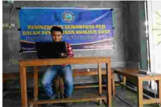
Gambar 2. Penyampaian Maten Pengabdian

Pada pembahasan basil pengabdian yang merupakan uraian deskriptif hasil wawancara oleh owner dari Kedai Kopi Rakyat Bondowoso. Desa Bataan Kee. Tenggarang Kab. Bondowoso. Adapun materi manajemen strategi yang disampaikan meliputi 1) penjelasan persaingan dunia bisnis di era modern, 2) penjelasan rentang strategi bisnis, dan 3) penyusunan strategi berupa analisis SWOT dari proses analisis, penyusunan, dan pembuatan strategi bisnis yang benar serta mudah dipahami yang sesuai dengan kebutuhan dan sesuai dengan permasalahan yang telah disampaikan dan didiskusikan bersama.