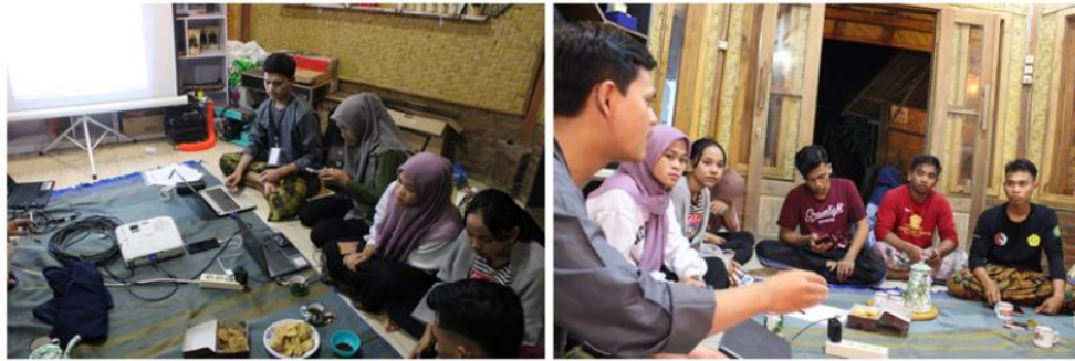
Gambar 1. Pelaksanaan Pelatihan dan Pendampingan