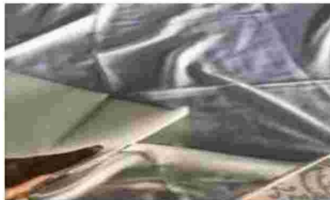
Gambar 13. Kain sunbond

Siapkan kain sunbond sesuai kebutuhan potong menjadi beberapa bagian.