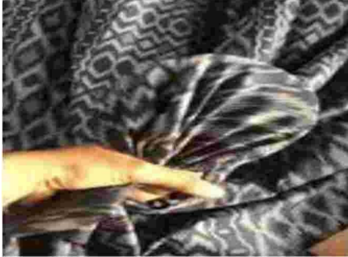
Gambar 9. Bahan pembuaran buket