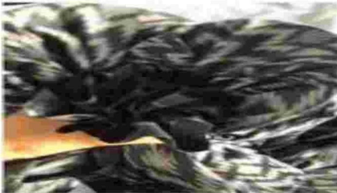
Gambar 10. Rangkaian dasar buket dari kardus bekas