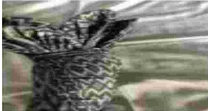
Gambar 11. Rangkaian dasar buket dari kardus bekas