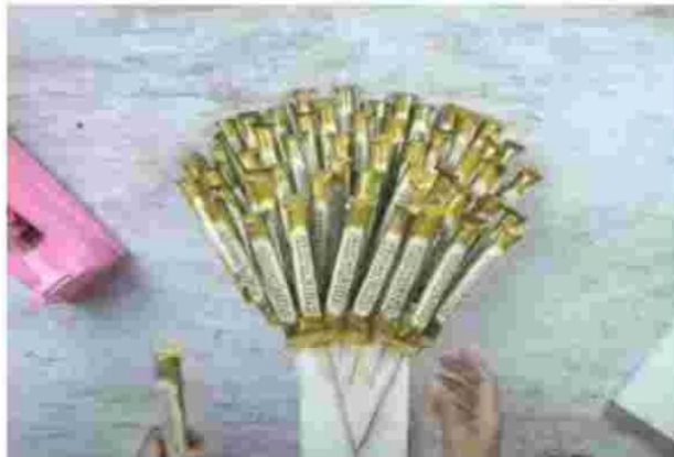
Gambar 6. Rangkaian buket