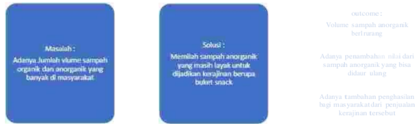
Gambar 1. Masalah dan Usulan Solusi yang ditawarkan

Fenomena tersebut maka kami ingin memberikan pelatihan kepada para pelaku UMKM yang ada di Kelurahan Bandar Kidul untuk memanfaatkan kardus dan styrofoam ini menjadi buket yang cantik.