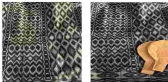
Gambar 8. Teknik pembuatan buket denga nisi kain tenun ikat dari kardus bekas

Siapkan kardus yang telah dibentuk seperti Digambar dan selemba kain