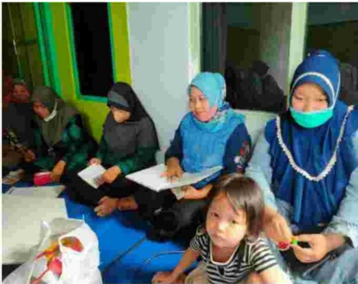
Gambar 1. Sosialisasi pemanfaatan kardus bekas dan styrofoam

Langkah yang pertama ini adalah pemateri menyampaikan alasan kenapa dilaksanakan pelatihan ini. Pelatihan pembuatan buket dengan memanfaatkan kardus dan styrofoam bekas ini tujuan utamanya adalah untuk mengurangi sampah kardus dan styrofoam bekas yang ada di lingkungan kelurahan bandar kidul. Karena seperti kita ketahui Bersama sampah non organik ini sangat sulit untuk diuraikan oleh mikro organisme, maka jika kita tidak bisa mengalihkannya dengan baik, maka akan terjadilah pencemaran lingkungan yang pada akhirnya akan sangat mempengaruhi ekosistem yang ada.