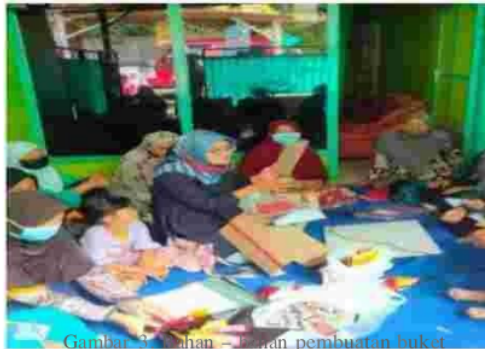
Gambar 3. Bahan – bahan pembuatan buket