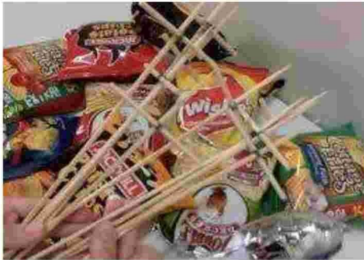
Gambar 5. Rangkaian buker

Satukan snack dengan tusuk sate satu persaru hingga bahan isin habis, rekatkan menggunakan isolasi atau lem tembak.