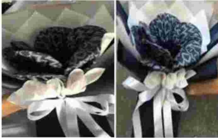
Gambar 17. Rangkaian