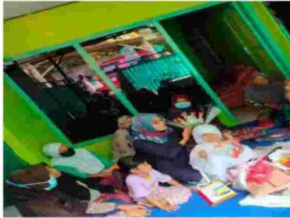
Gambar 2. Pengenalan merangkai buket

karangan bunga(KBBI n.d.). Sering dengan perkembangan zaman buket tidak hanya identik dengan buket bunga, tetapi buket bisa diisi dengan berbagai barang kita inginkan diantaranya : buket snack, buket bunga, buket minuma, buket uang, dan lain sebagainya. Buket juga bernilai ekonomi tinggi dan cenderung sangat disenangi oleh kaula muda. Buket dapat dijadikan sebagai alternatif kado kekinian saat ini, Dengan buket yang cantik orrang yang ridak ingin membeli produk kita jadi lebih bersemangat unruk membeli produk kita karena tergiur akan kecanrikan dari buket tersebut.