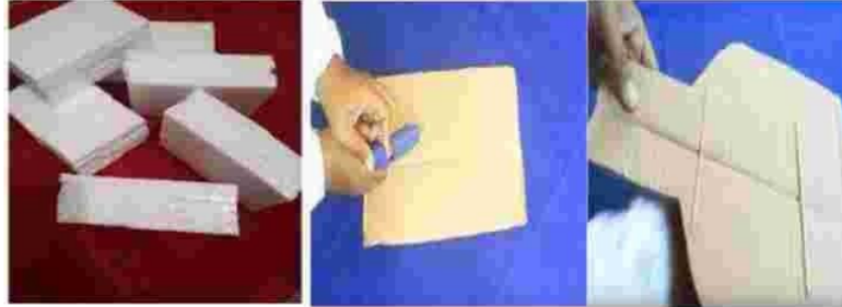
Gambar 4. Teknik membuar buket

Siapkan Sterofoam potong sesuai dengan kebutuhan, Buatlah 3 ukuran styarfoam yang akan digunakan untuk menancapkan tusuk sate berisi scank.satukan ketiganya beri lapisan berupa porongan kardus bekas lilitkan pada srofoam yang sudah dibuat hingga rapi.