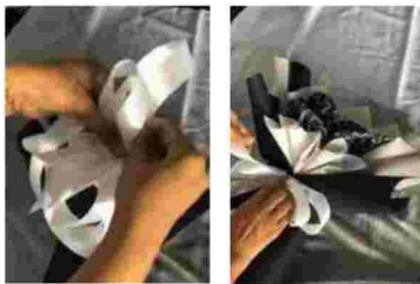
Gambar 16. Rangkaian buket