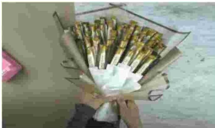
Gambar 7. Buket berbahan sterofoam

Siapkan kain sunbond atau kertas cellopane yang akan digunakan untuk membungkus buket. Potong menjadi beberapa bagian dan susun dengan rapi hingga selesai beri pita sebagai pemanis dan jadilah sebuah buket cantik.