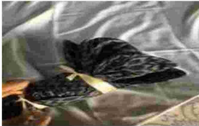
Gambar 12. Rangkaian dasar buket dari kardus bekas

Ikut dengan rapat bagian sisa kain tersebut seperti gambar dibawah ini