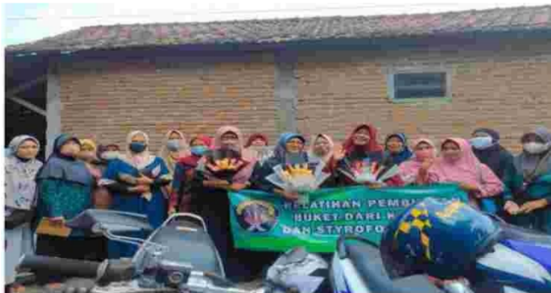
Gambar 18. Hasil pelatihan membuat buket dari kardus bekas dan sterofoam

Memberikan wawasan pengetahuan kelayakan bisnis dari pembuatan buket snek ini. Peserta disini diberikan gambaran tentang harga jual dan daya saing buket ini dipasaran. Setelah kegiatan diatas dilaksanakan diskusi dan mentoring kesulitan apa yang dihadapi saat para peserta membuat buket ini, Buket ini bisa diisi dengan snack maupun kain tenun.