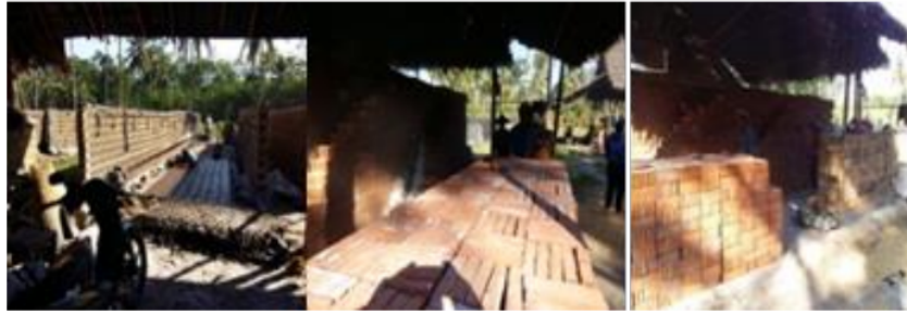
Gambar 3. Monitoring hasil pelatihan