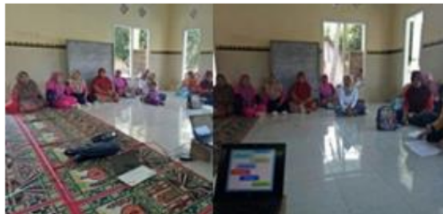
Gambar 2. Pelaksanaan Pelatihan Kewirausahaan

Pelaksanaan pelatihan kewirausahaan dilakukan pada hari rabu, tgl 14 dan 15 september 2022 di desa bago terhadap 10 orang pelaku usaha batu bata dan 10 orang masyarakat dengan menghadirkan 2 praktisi. hari pertama Praktisi memberikan materi terkait dasar dasar berwira usaha yang baik dan hal hal yang tidak perlu dilakukan dalam berwirausaha. Peserta diwajibkan mempraktekan terhadap usahanya masing masing. Hari kedua peserta memberikan materi terkait bagaimana menjual produk yang baik ke konsumen.