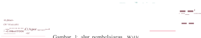
Gambar 1: alur pembelajaran wj11