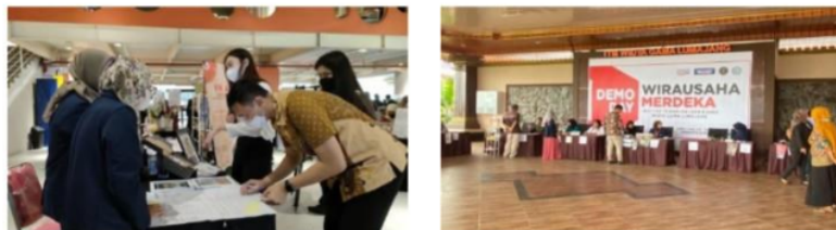
Gambar 4: Demoday, bentuk Sustainable business pitching

Desain yang dikembangkan pada fase atau tahap ini adalah, mahasiswa melakukan pameran atas produk atau prototype yang dihasilkan. Mahasiswa mendapatkan banyak masukan dari pengunjung dalam bentuk kritik atau saran, sehingga menjadi input untuk memperbaiki. Hal ini merupakan bagian dari evaluasi dalam pengembangan bisnis kedepannya. Konsep keberlanjutan juga dibangun dengan memperhatikan isu-isu sebagaimana yang tertuang dalam sustainable development goals (SDGs) yang menjadi penyepakatan internasional dalam membangun masyarakat internasional (Dinnanta & Juraeni, 2020).