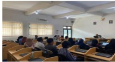
Cambar 2. Mentoring DPL secara offline

Tahapan ini dilaksanakan pada minggu 1 (satu). Adapun pembelajaran yang disampaikan adalah dengan memberikan model training motivasi serta sharing pengalaman dari para tokoh bisnis yang berhasil. Hasilnya mahasiswa mampu menelaah dengan baik pada posisi seperti apa saat ini, dan bagaimana membangun visi entrepreneur termasuk dalam membangun sebuah bisnis yang berkelanjutan. Visi kewirausahaan mampu memberikan dorongan bagi mahasiswa dalam melakukan tindakan proaktif dan kreatif (Nurwadjah et al., 2020; Seryobakti, 2017). Output dari desain thinking mahasiswa mampu mengenali potensi diri dan lingkungan yang cocok untuk berwirausaha serta memahami kebutuhan masyarakat yang dapat berpeluang menjadi bisnis.