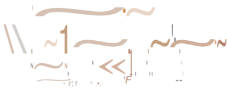
Gambar 3: contoh produk ufo petty Hasil proses Business model ideation dan Business model validation and refining iteration

Harapan bisnis yang dikembangkan benar benar didasarkan atas analysis yang mendalam diantaranya, aspek pemilihan segmentasi pasar, target dan posisi yang tepat. Pendalaman pada lingkungan eksternal juga dilakukan diantaranya pada pesaing dengan melakukan benchmarking, dan yang berikutnya adalah menuangkan dalam model bisnis canvas, untuk melihat secara mendalam profil bisnis yang dijalankan. Pengembangan ini tenru akan memberikan pembelajaran mengenali lebih jauh terhadap bisnisnya. mendapatkan kepekaan ketika situasi mengalami perubahan dan seterusnya (Pamungkas et al., 2021; Setyobakti et al., 2021).