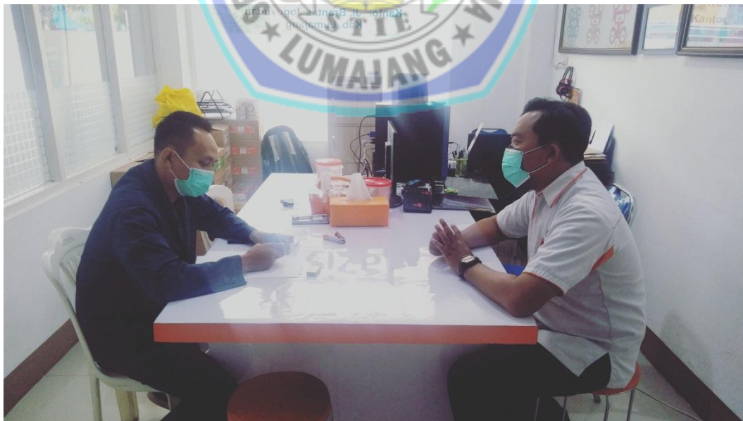
Wawancara dengan Kepala Kantor LAZISMU Kabupaten Lumajang