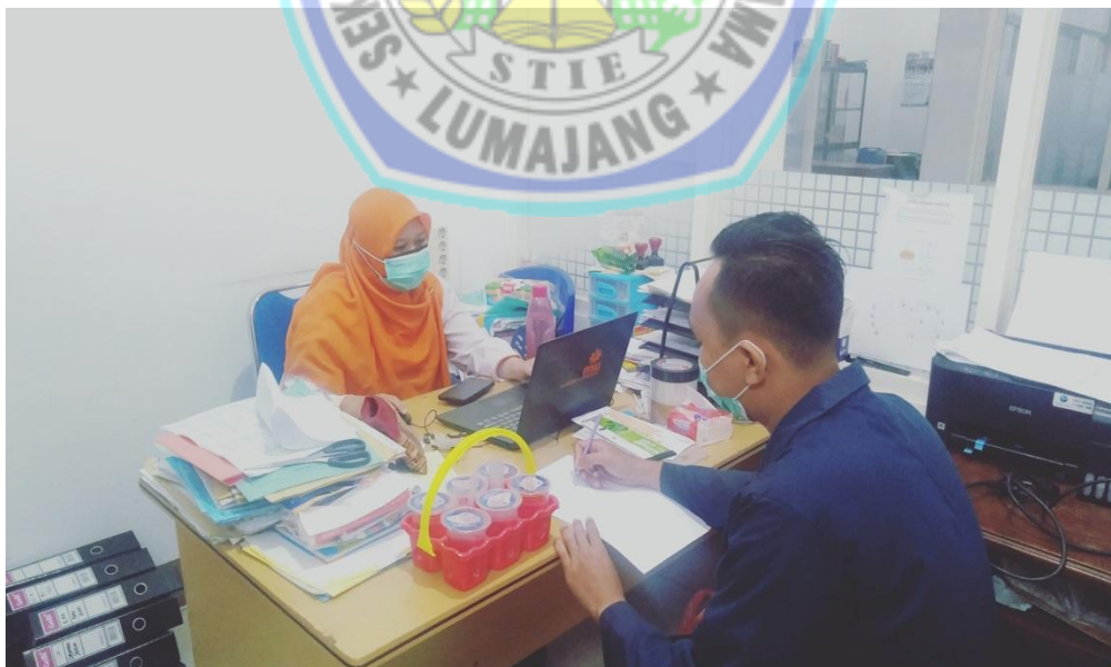
Wawancara dengan Staff Keuangan LAZISMU Kabupaten Lumajang